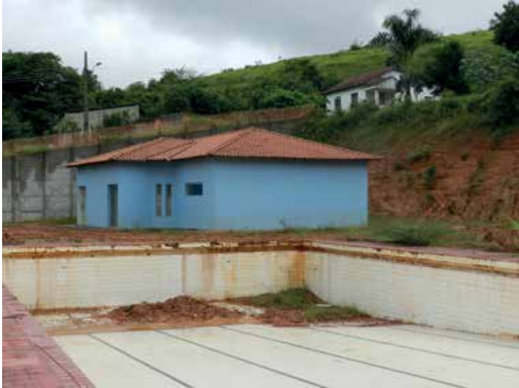
Piscinas foram esgotadas e limpas para impedir surgimento de larvas do Aedes aegypti