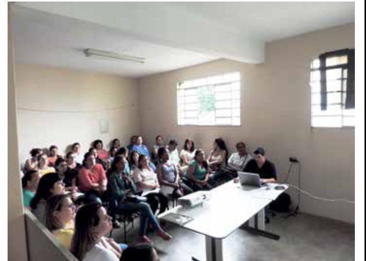
Treinamento ocorreu na sede da Vigilância Epidemiológica, órgão vinculado à Secretaria Municipal de Saúde

Novos procedimentos de preenchimento de formulários, abordagem de pessoas e classificação estão sendo adotados. – O batalhão de enfrentamento da dengue vai às ruas e conta com a colaboração e parceria dos cidadãos. Os munícipes, por sinal, são o principal elo na corrente contra as doenças transmitidas pelo Aedes aegypti.