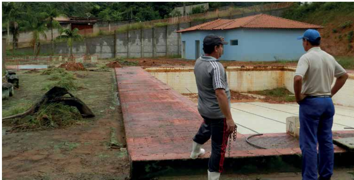
Limpeza das piscinas do Machado Esporte Clube, área que passa por reformas

A Prefeitura de Machado realiza a limpeza geral de toda a estrutura do Machado Esporte Clube, principalmente as piscinas, que podem se transformar em focos reprodutores do mosquito transmissor da dengue e de outras doenças. A Secretaria de Saúde, através da Vigilância Epidemiológica, organiza batalhão de agentes de endemias e agentes de saúde para, junto da população, tentar eliminar os focos de proliferação do Aedes aegypti , inseto transmissor da Dengue, do Zika Vírus e da Febre Chikungunya.