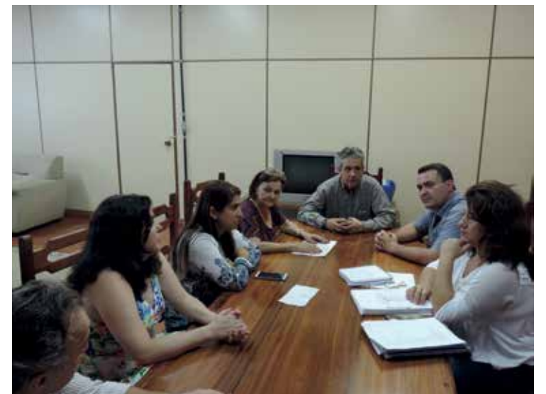
Primeira reunião ocorreu na primeira quinzena de janeiro