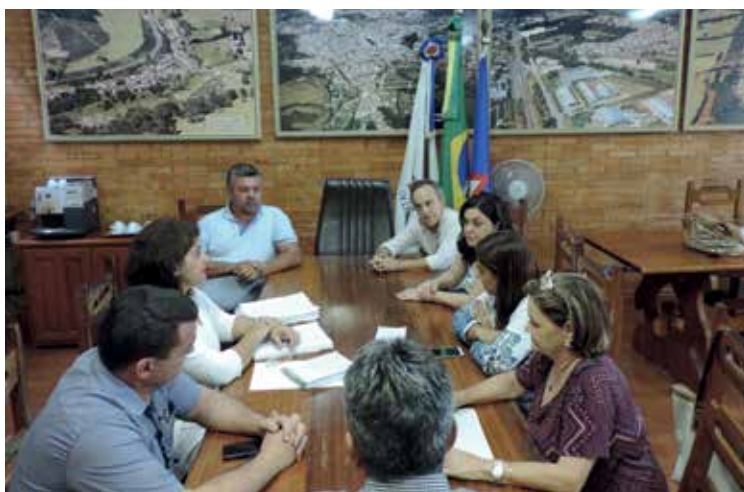
Secretários da Administração Municipal, vereadores e diretores da Santa Casa discutem repasse de subvenção pública

Secretários Municipais de Planejamento, Governo e Saúde, além da Assessoria de Gabinete da Prefeitura de Machado, e, de dois vereadores, representantes do Poder Legislativo, reuniram-se, quarta-feira, dia 13, com a Direção da Santa Casa de Caridade de Machado para discutir o repasse de subvenção pública, no valor, hoje, de R$ 180 mil por mês. – Com a queda na arrecadação, o Município renegocia com as entidades subvencionadas o valor do repasse aprovado pela Câmara.