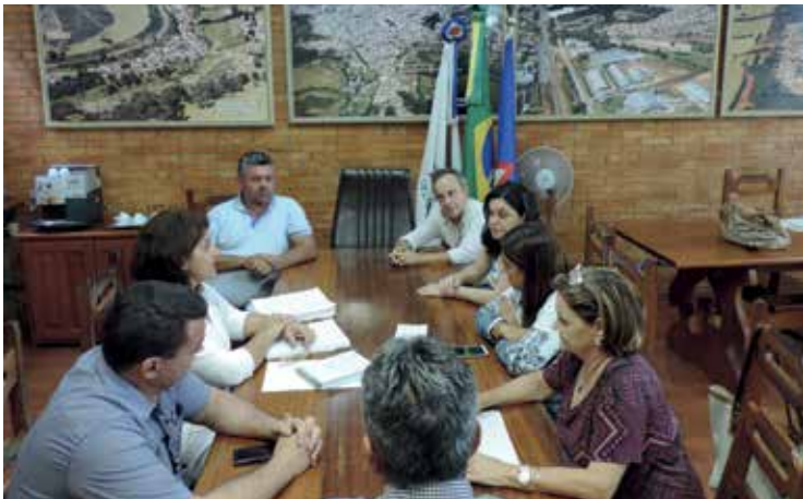
Prefeitura e Santa Casa reuniram-se para rediscutir possível redução dos valores da subvenção pública