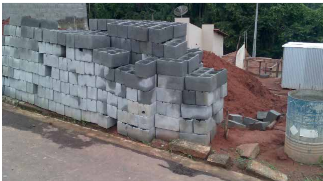
População precisa estar atenta e zelar pela saúde de todos, inclusive, dos vizinhos. Blocos de construções são criadouros de larvas e pontos ideais para reprodução ao Aedes aegypti.

O Trabalho de conscientização irá ocorrer na rotatória da Praça Antônio Carlos, sexta-feira, dia 26, às 14h30