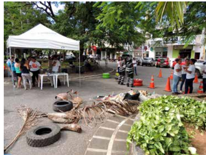
Secretaria de Saúde construiu cenário ideal para o mosquito