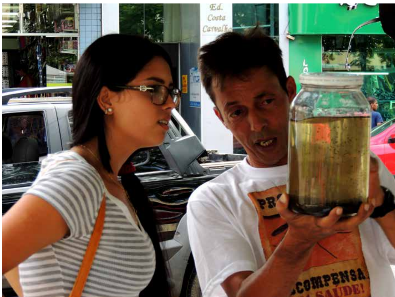
Agente de Combate a Endemias faz explicação sobre a evolução do mosquito Aedes aegypti

Comando da Polícia deslocou militar que auxiliou Prefeitura a parar os motoristas e a afixar adesivos nos veículos