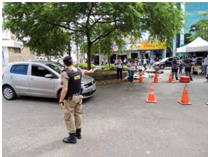
Policial Militar auxiliou na parada de veículos