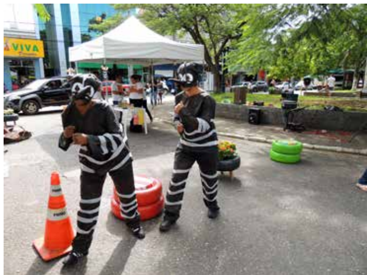
Voluntários se caracterizaram de mosquito transmissor