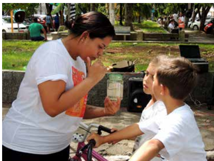
Crianças observam, com interesse, palestra