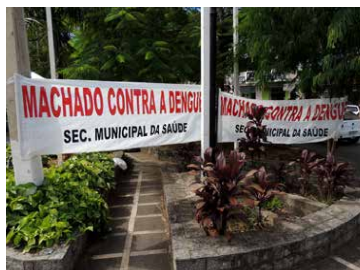
Prefeitura tem cumprido sua obrigação de orientar