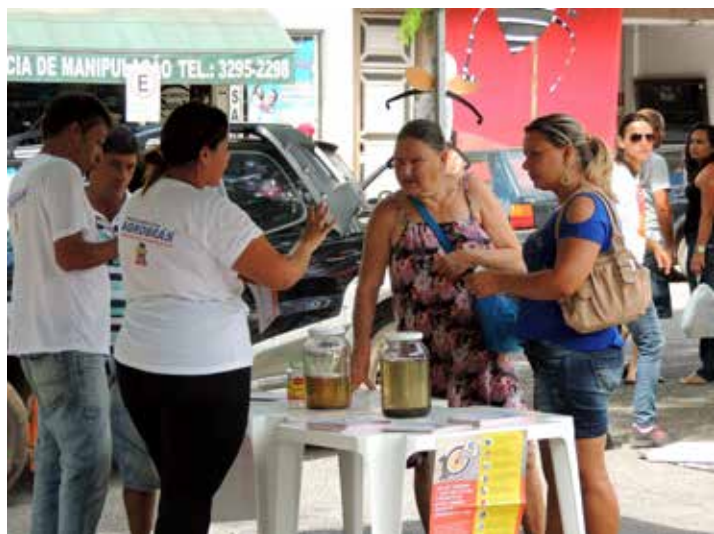
Agentes de Combate a Endemias dão explicação